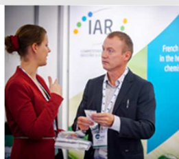
Stand IAR 2015