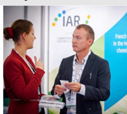
Stand IAR 2015